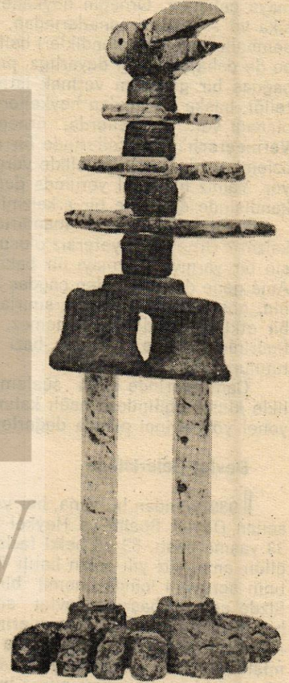
Olivier Leloupl Heykel

lendirmeye götürücü öğelerden uzaktır. Ama bir okulun yıllık çalışma hacmini ve deneysel gücünü göstermesi bakımından da, bu kabil sergilerden bekleneni vermiyor değil. Önemli olan, öğrencilerin bununla yetinmeyip, teknik ayrıntıların tükenmez yönlerini kurcalayarak beğeni çizgilerini yüceltmeleri ve kendimize ilişkin değerlere yeni katkılar getirmeleridir. Bunu tümünden beklemek biraz da safdillik olur aslında. Ama geleceğe dönük cesur araştırmaların -belki ilerde- bu gençler arasında filizlenmesi beklenebilir. Zaman, elenmeye boyun eğenleri eleyecek, kalanlara ise yetenekleri ölçüsünde değer ekleyecektir.